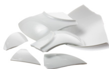
STIKLA UN PORCELĀNA TRAUKUS