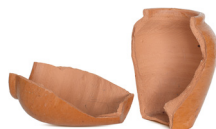
MĀĻA UN KERAMIKAS PUDELES